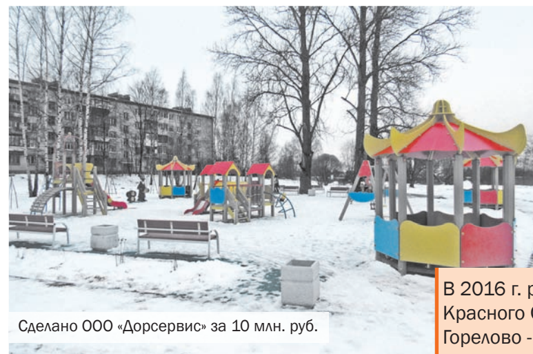
Сделано ООО «Дорсервис» за 10 млн. руб.

В 2016 г. расходная часть бюджета Красного Села составляла 160 млн. руб., Горелово - 150 млн. руб.