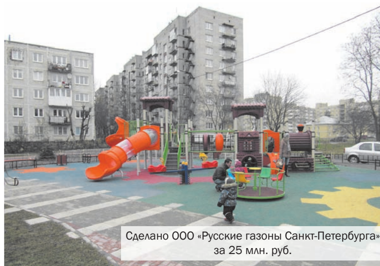
Сделано ООО «Русские газоны Санкт-Петербурга» за 25 млн. руб.

Гореловский муниципалитет работал проще, укрупнив большинство контрактов до неприличных размеров. В итоге здесь почти на ту же сумму, что и в Красном Селе (117 млн. руб.), контрактов было заключено в два раза меньше - лишь 28. Подрядчиков нашлось тоже немного - всего 18, в том числе 2 индивидуальных предпринимателя. При этом 18 контрактов на сумму 110 млн. рублей, а это 85% от всех осваиваемых денег, принесли экономию менее 1%. Так что гореловские муниципалы хозяйству-